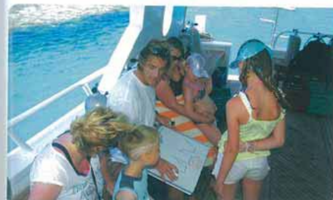
Le briefing préalable est essentiel.